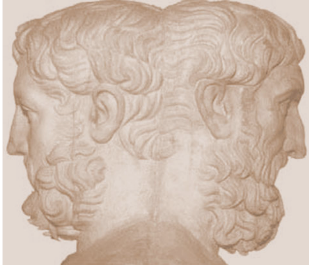
l'effetto giano di dentro la mia pelle